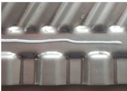
写真 3. 接着剤塗布量目安

新食品用接着剤 F-3 は粘度が低く、塗布量が多いとガスケット装着時に接着剤がはみ出してしまうため注意下さい。 塗布量の目安は写真 3 を参考とし、接着剤塗布幅が約 1.0mm 程度となる様にガスケット装着部へ塗布下さい。 写真 4 の様に接着剤をへら等で薄く延ばすことで、乾燥時間短縮及び接着性が向上します。写真 5 の様にガスケット装着後、接着剤がはみ出した場合はアルコールで接着剤を溶かしウェスで拭き取って下さい。