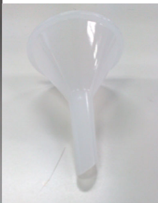
写真 2. 市販漏斗