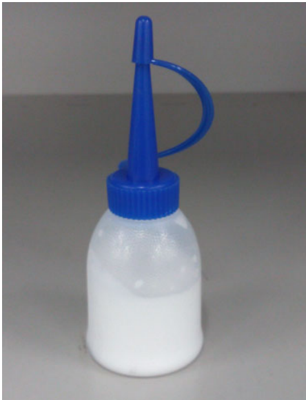
写真 1. 専用オイラー

新食品用接着剤 F-3 は、弊社供給の専用オイラーへ移してから使用下さい。（粘度が低いため、口径 0.5mm を採用） 移し替える際、市販の漏斗等を用いると作業がスムーズです。