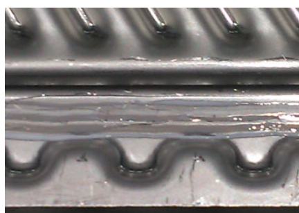
写真 4. 接着剤伸ばし